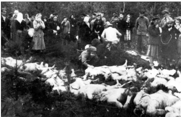
Похороны 19 мирных граждан, расстрелянных нацистами и их местными пособниками в августе 1944 года вблизи города Слока, 1945 год (8)